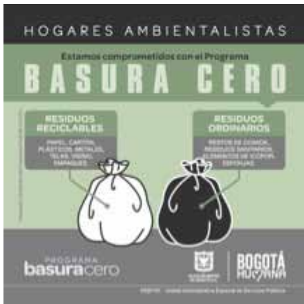
GRÁFICO 1: Guía de separación

La Administración se propuso el desarrollo de estrategias de separación en la fuente bajo un sistema simple consistente en una bolsa negra para todo aquello que no es reciclable y una bolsa blanca para los materiales reciclables. Se solicita a los ciudadanos que saquen las bolsas de la basura el mismo día dejando tiempo para que la ruta de recolección selectiva pase, tras lo cual la ruta de residuos ordinarios recoge todo lo demás, dejando el área limpia.