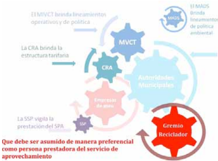
GRÁFICO 4: Nuevo Marco institucional del servicio público de aseo

Nota: MVCT (Ministerio de Vivienda, Ciudad y Territorio); CRA (Comisión Reguladora de Agua Potable y Saneamiento Básico); MADS (Ministerio de Ambiente y Desarrollo Sostenible), SSP (Superintendencia de Servicios Públicos); PGIRS (Planes de Gestión Integral de Residuos Sólidos), EC (En construcción).