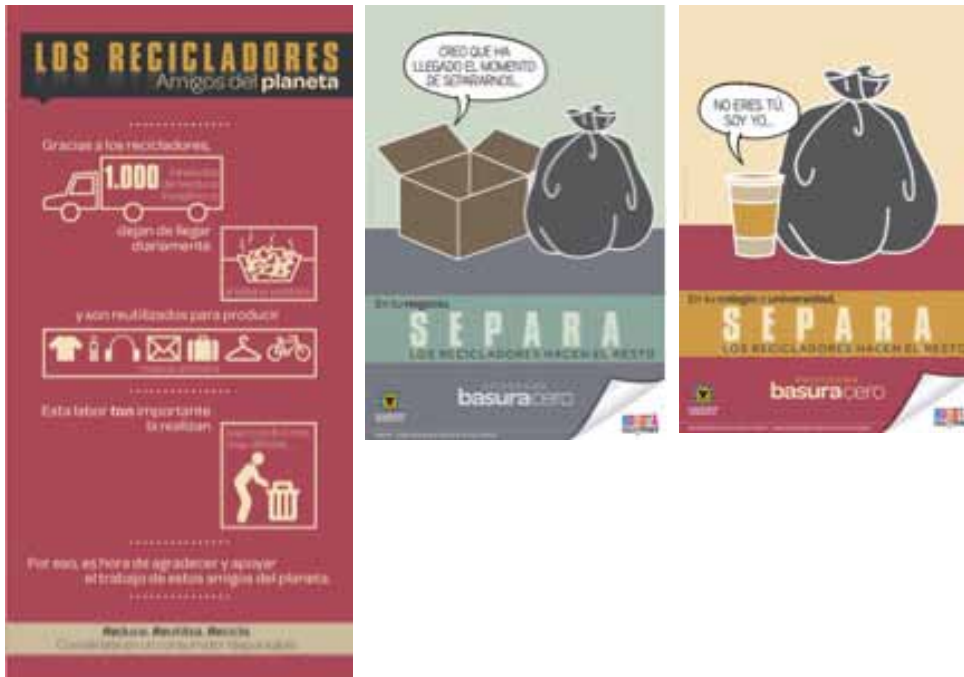
GRÁFICO 3: Imagen de campaña

Promoción de separación y entrega del reciclaje a los recicladores. Se están desarrollando una serie de campañas mediáticas que buscan el cambio de hábitos de separación bajo el esquema de bolsa blanca para residuos reciclables y bolsa negra para residuos no reciclables. Esta campaña ha tenido especial énfasis en la visibilización del reciclador como gestor de los residuos. Bajo el lema “separa, el reciclador hace el resto”, la campaña ha buscado sensibilizar a los usuarios del servicio de aseo sobre su responsabilidad con la ciudad y con el reciclador. Es muy temprano para medir su impacto, no obstante, varios líderes recicladores han manifestado que ellos al igual que sus bases sociales han sentido un ligero y positivo cambio en las relaciones con otros actores de la ciudad. No obstante, es preciso generar mecanismos no sólo de sensibilización, sino también de exigibilidad de la separación y entrega de residuos reciclables a los recicladores por parte de la ciudadanía en general.