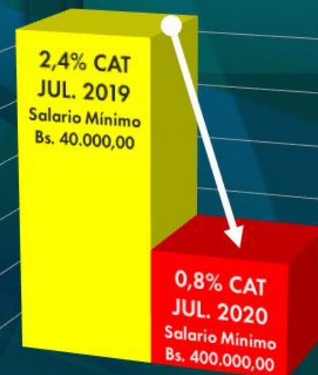
Poder Adquisitivo del Salario Mínimo Jul. 2019 - Jul. 2020

PULVERIZADO EL SALARIO Y EL PODER DE COMPRA DEL BOLÍVAR COMO MONEDA DE CURSO LEGAL DE VENEZUELA.